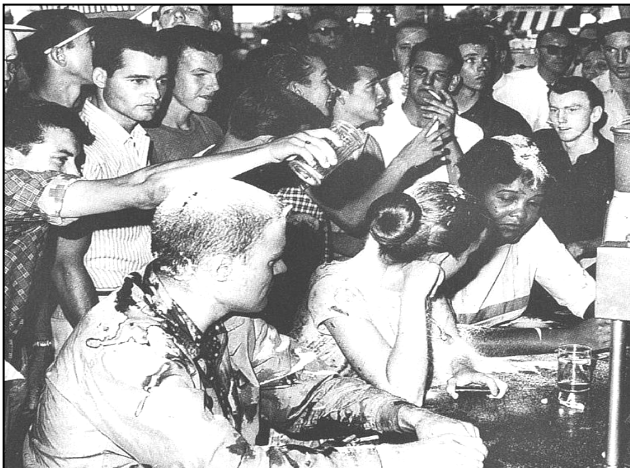
[Uit Parting the Waters: America in the King Years 1954–63 deur T Branch]

Die bron hieronder is 'n foto uit 'n boek met die titel Parting the Waters: America in the King Years 1954–63 deur T Branch. Dit toon drie studente wat op 28 Mei 1963 aan 'n sitstaking by 'n middagete-toonbank in Jackson, Mississippi, deelneem. 'n Lid van die wit groep gooi 'n vloeistof oor 'n sittende student uit.