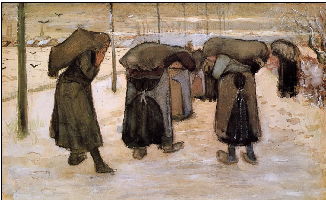
[Bron: Van Gogh, V. (1882). Women Carrying Sacks of Coal in the Snow [Pen en waterverf].